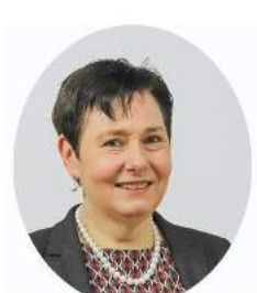
Beitrag von Karin Mar Prodatex GmbH

Führung in der Transformation bedeutet, nicht nur den Kurs zu setzen, sondern das Team auch durch turbulente Gewässer zu steuern. Mit einem klaren Fokus, fest verankerter Unternehmenskultur und Ihrer Unternehmung dauerhaft wettbewerbsfähig bleibt. Verwandeln Sie also Ihre Transformation in nachhaltigen Erfolg.