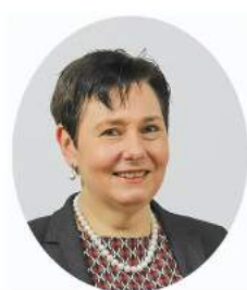
Beitrag von Karin Mar Prodatex GmbH

Mit besten Wünschen für ein erfolgreiches Jahr